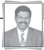
P.C. மிலேமோன் ராஜா ஆசிரியர் - கிருபையுள்ள வார்த்தை