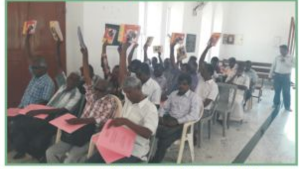
நெல்லைவில் பிப்ரவரி மாதம் நடைபெற்ற பார்வையற்றோர் முகாமில் நமது ஆசிரியர் தேவ சப்தி வழங்கியபோது ..