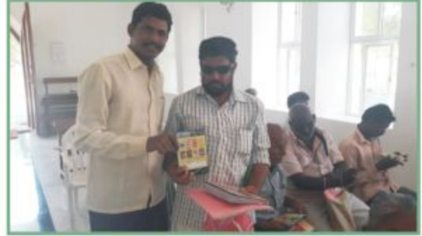
பார்வையற்றோருக்கு வழங்கப்பட்ட பிளேஸ் பத்திரிக்கைகளும் பைபிள் சிடியும்...