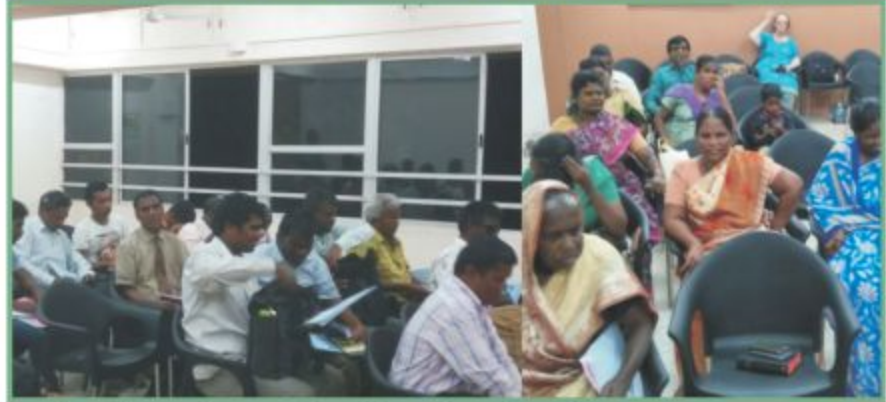
இம்மாதம் பெங்களூரில் நடைபெற்ற பார்வையற்றோர் முகாம்